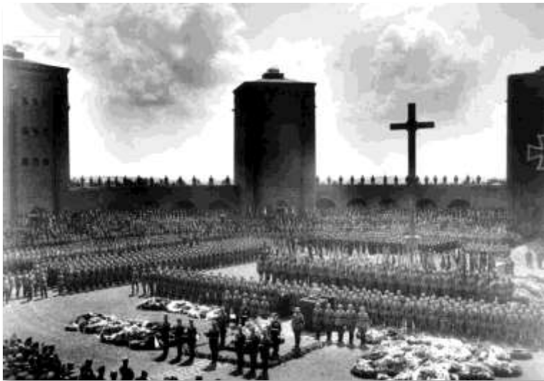
Fig. 6 - Funeral do Marechal Paul Hindenburg no Tannenberg-Denkmal