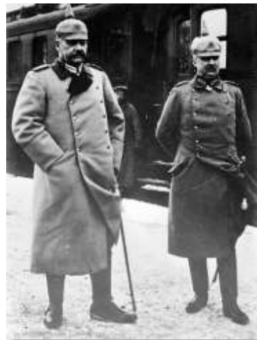
Fig. 1 – Os generais Paul von Hindenburg e Erich von Falkenheyn, vencedores da Batalha de Tanneberg

comando dos generais Paul von Rennenkampf e Alexander Samsonov (figura 2), respectivamente. Combinados, as forças russas totalizavam mais de 500 mil homens.