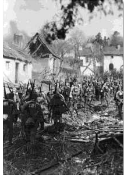
Fig. 3 – Infantaria alemã deslocando-se para ocupar posição de ataque

a se fechar na região ao sul de Allenstein.