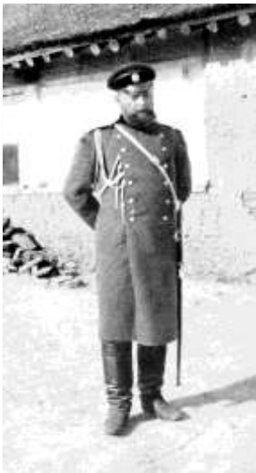
Fig. 2 – General Alexandr Samsonov, comandante do 2º Exército russo

desprevenidos. Hindenburg e Ludendorff substituíram o General Maximilian von Prittwitz e o Marechal de Campo August von Mackensen dois dias depois 9 . Apesar da derrota, os alemães infligiram baixas significativas aos russos e descobriram os planos de batalha russos junto ao corpo de um oficial morto.