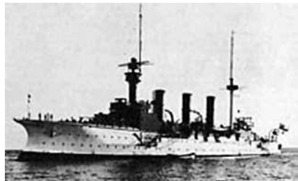
Fig. 2 – Cruzador alemão SMS Vineta .

Na sequência das atividades bélicas, as canhoneiras Tortumo e General Crespo foram rebocadas para mar aberto e afundadas. A Ossum e a Margarita , abordadas pelo cruzador inglês HMS Retribution , tiveram suas máquinas destruídas e o SMS Gazelle apreendeu a Restaurador , arresitou sua tripulação e transferiu o navio para a Marinha Alemã. Todas estas embarcações já estavam sob o domínio dos europeus desde 9 de dezembro.