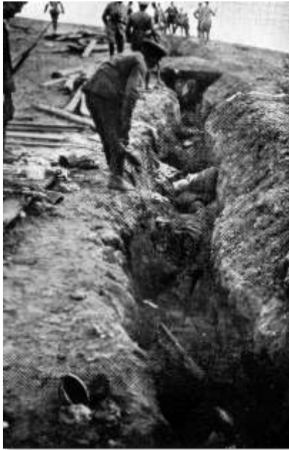
Fig. 4 – Soldados russos mortos no interior de trincheira, perto de Usdam

operacional compensou inferioridade numérica.