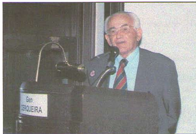
General-de-Brigada Nilton de Albuquerque Cerqueira