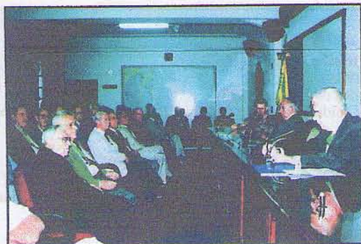
Aspecto do auditório.