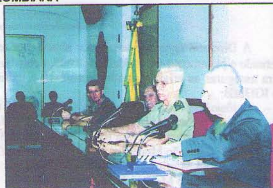
Mesa que presidiu a sessão.