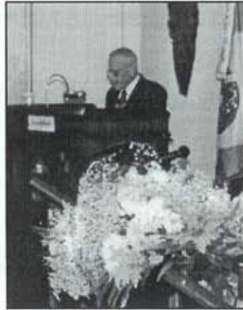
“Causas e Reflexos da Segunda Guerra Mundial” General-de-Exército JONAS CORREIA