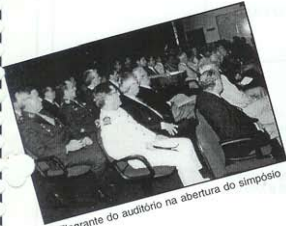
Flagrante do auditório na abertura do simpósio