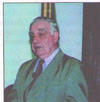
General-de-Brigada Sérgio A. de Avellar Coutinho