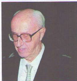
Embaixador Vasco Mariz