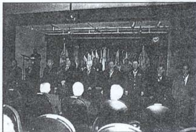
Posse dos Sócios Titulares no IGHMB.