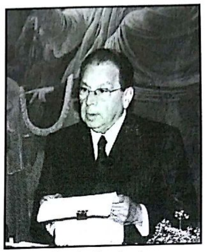
Conferência do Ministro Célio Borja.