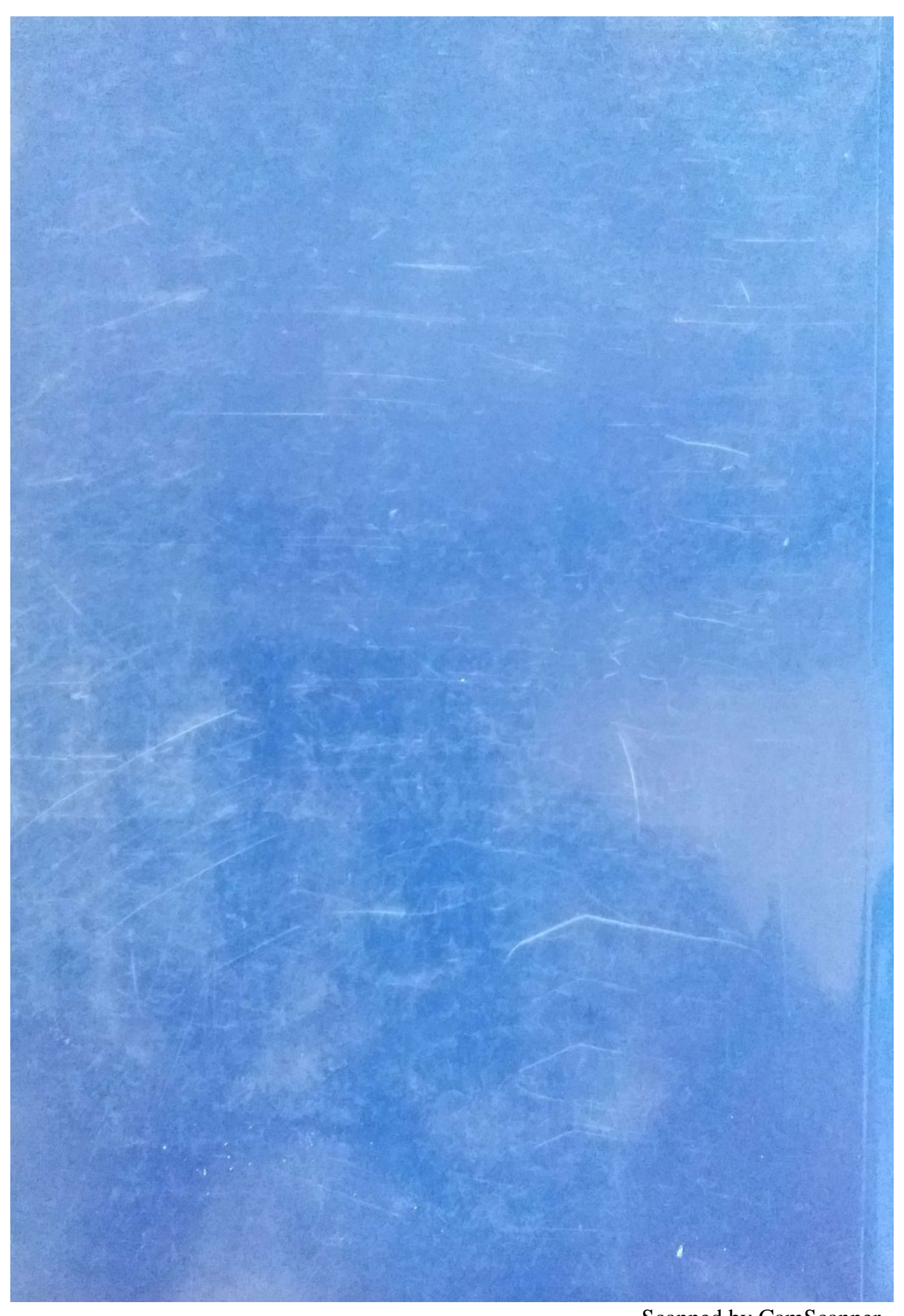
Scanned by CamScanner