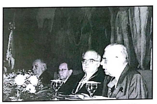
Mesa que presidiu a sessão de abertura.

O IGHMB e o IHGB promoveram um Simpósio, nos dias 19, 20 e 21 de agosto de 2003, como parte das comemorações do Bicentenário de Nascimento de Luiz Alves de Lima e Silva, Duque de Caxias. Realizou-se no Salão Nobre do IHGB e obedeceu à seguinte programação: