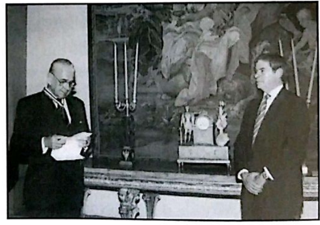
O Presidente do IGHMB ao receber a Ordem do Infante D. Henrique das mãos do Embaixador de Portugal no Brasil.

em congressos internacionais de História Militar, bem como por haver promovido o simpósio 500 Anos de História Militar Luso-Brasileira, ao ensejo das comemorações de meio século do descobrimento do Brasil.