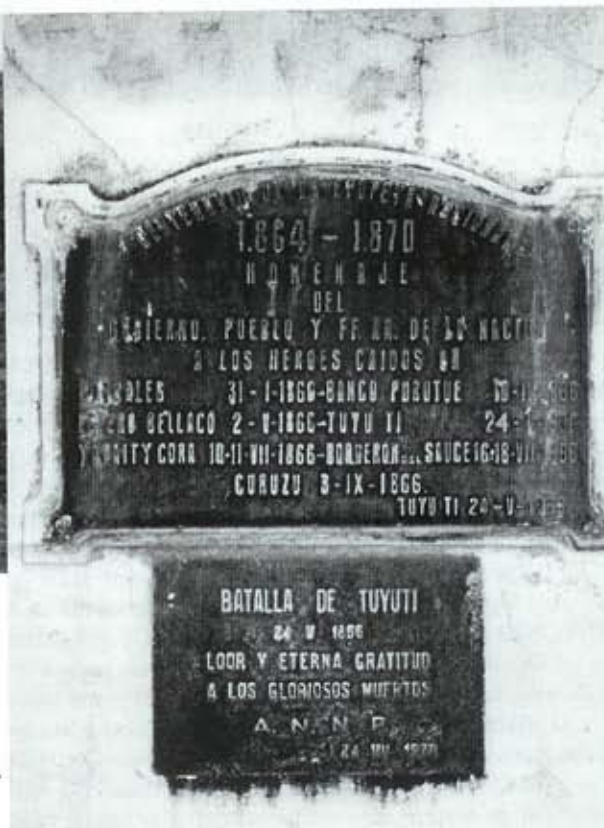
Placa existente no marco encontrado no campo de batalha de Tuyuti →