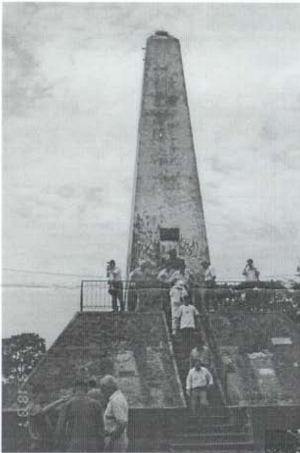
← Monumento erguido em Lomas Valentinas