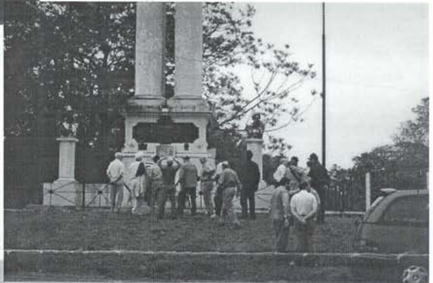
Monumento comemorativo dos combates travados no arroyo Itororó →