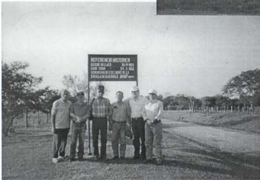
← Grupo de visitantes em Estero Bellaco